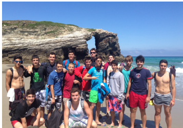
Playa de las Catedrales (uno de los diez paraísos mundiales) a 15 minutos del Campus