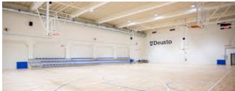
Nuevas instalaciones inauguradas en 2017

Por decimocuarto año consecutivo en un campus diferente en las instalaciones de la Universidad de Deusto (Bilbao). La actividad se realiza para jugador@s de baloncesto, donde podréis disfrutar del basket mejorando vuestra técnica.